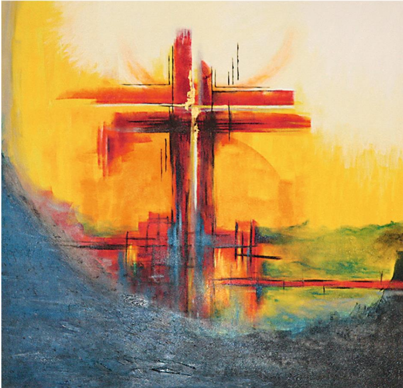
Auferstanden vom Tode, Christine Hartmann/Atelier14, Altargemälde. Ausschnitt aus einem Triptychon, Kreuzkirche, Fulda

Der Segen des Auferstandenen sei mit dir. Dass du dich in deinem Leid in seinen Wunden wiederfindest und mit ihm immer wieder neu ins Leben zurückkehrst. Und dass der Friede, den er dir wünscht dein Herz erreicht.